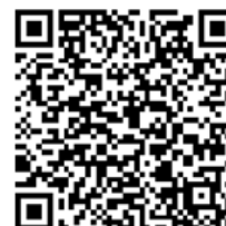
Roger Lebers Freitas Coordenador de Cadastros Matrícula: 3153049 PMS/SEFAZ/COD

A autenticidade deste documento poderá ser confirmada por meio deste QR Code.