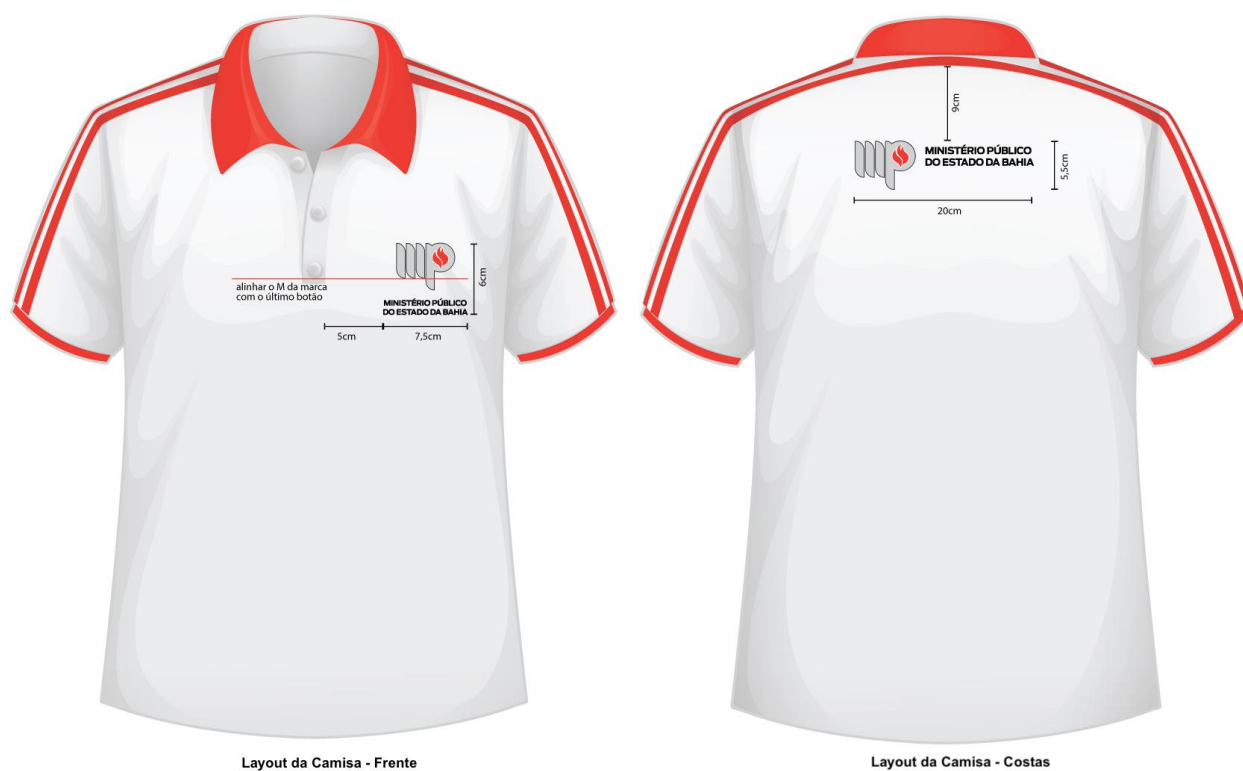
Figura 1 – Layout da camisa