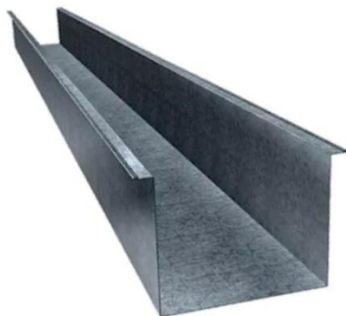
Figura 03 – Calha em chapa de aço galvanizado nº 24 ou equivalente técnico