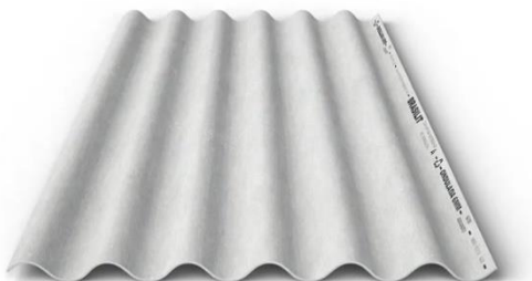
Figura 02 – Telha ondulada de fibrocimento

Sobre os caibros existentes será montado o novo telhado com telha ondulada de fibrocimento cuja espessura deverá ser de 6 milímetros, recobrimento lateral de 1 ¼ de onda, mantendo-se a inclinação atual. Trata-se de um sistema de cobertura de duas águas com sentido da queda para o centro da edificação.